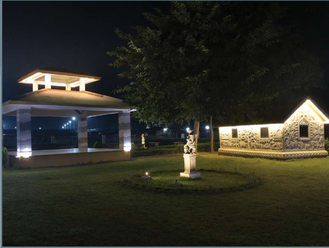
Abasarika - Senior Citizens' Park Parbirhata