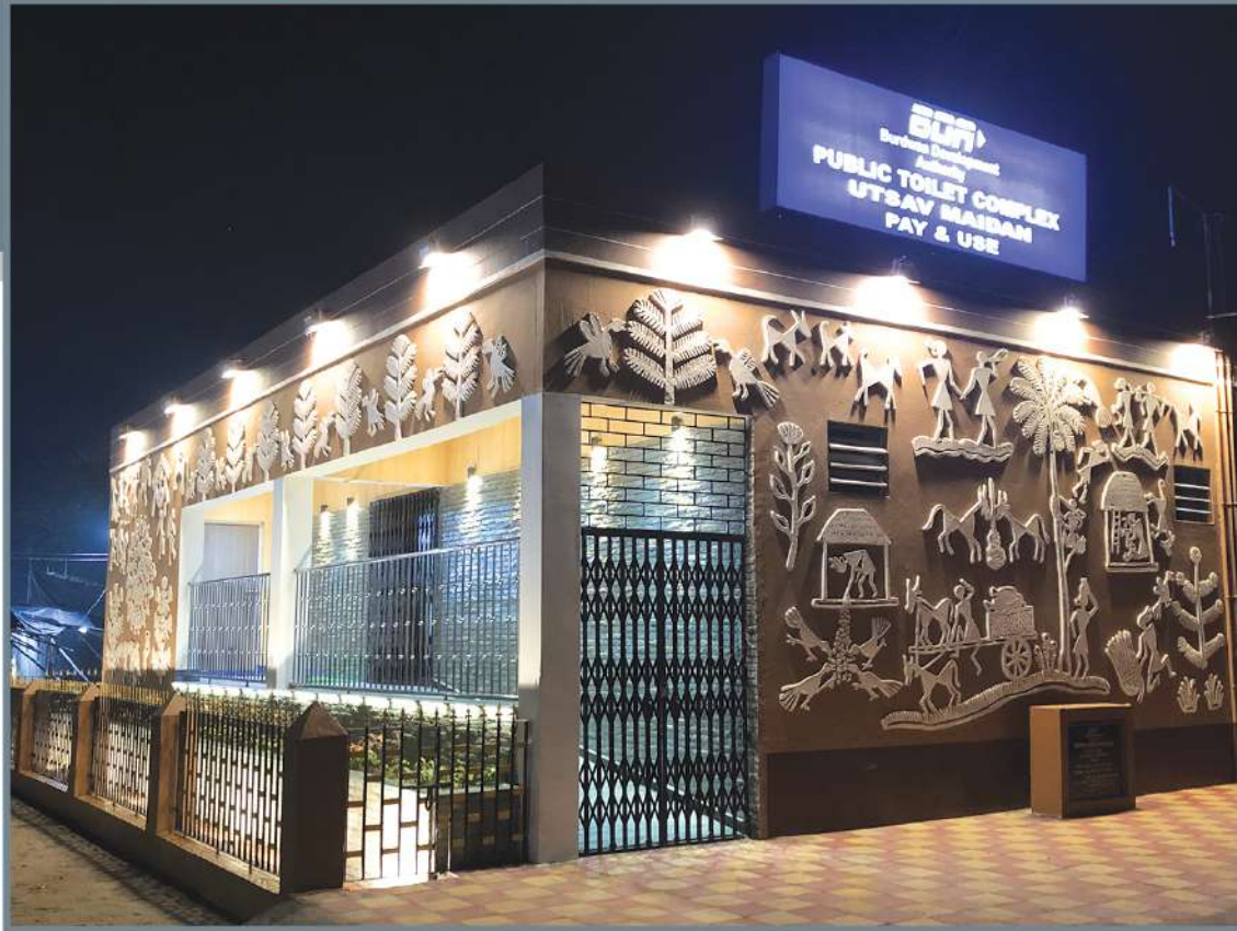
Public Toilet Complex Utsav Maidan