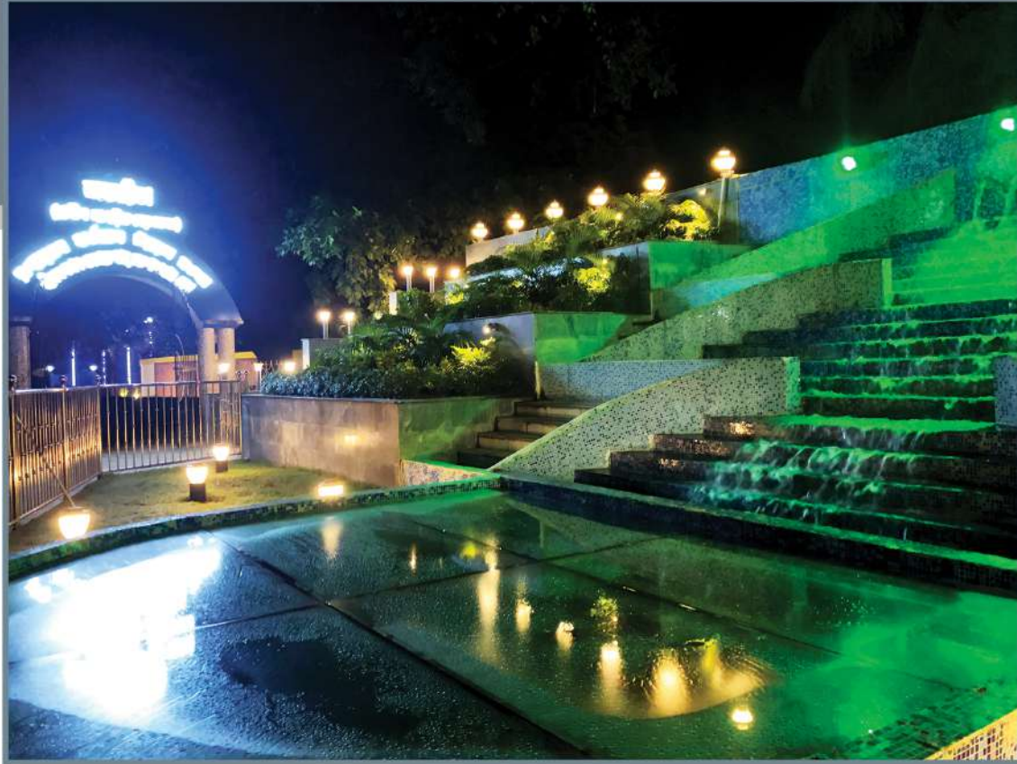
Step Garden Parbirhata