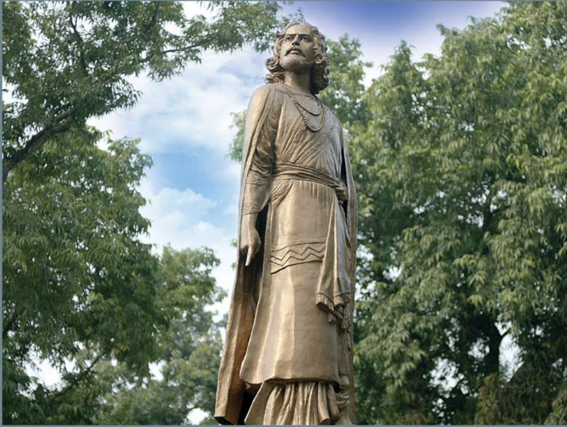
Statue of Rabindranath Tagore Burdwan University Campus