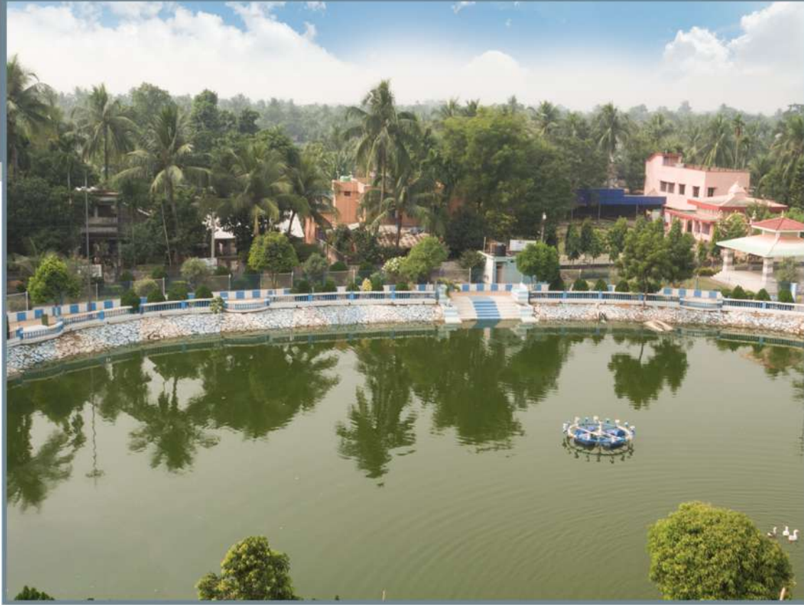
Abasarika - Senior Citizens' Park Kanchannagar