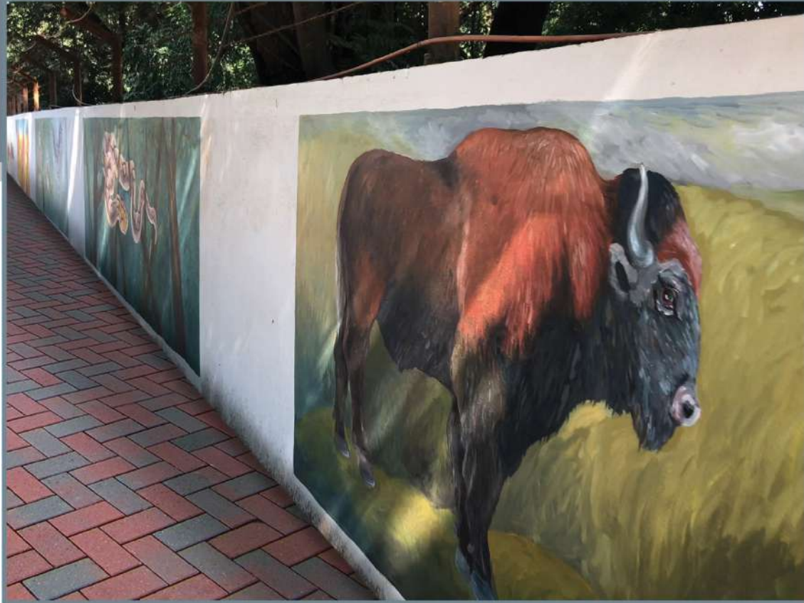
Wall Painting Golapbag Road