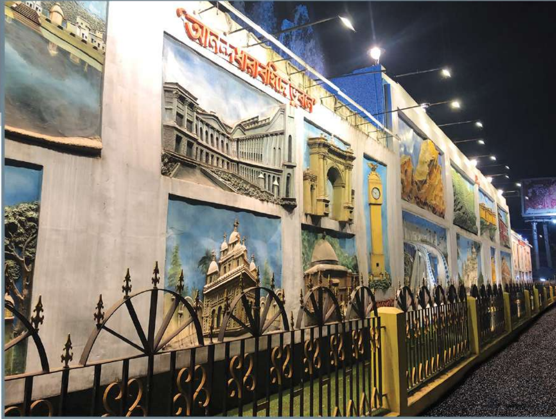
Mandela Park Two Wheeler Parking Station