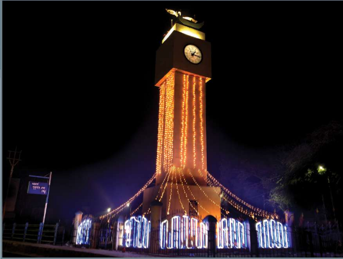
Clock Tower Birhata Banka Bridge